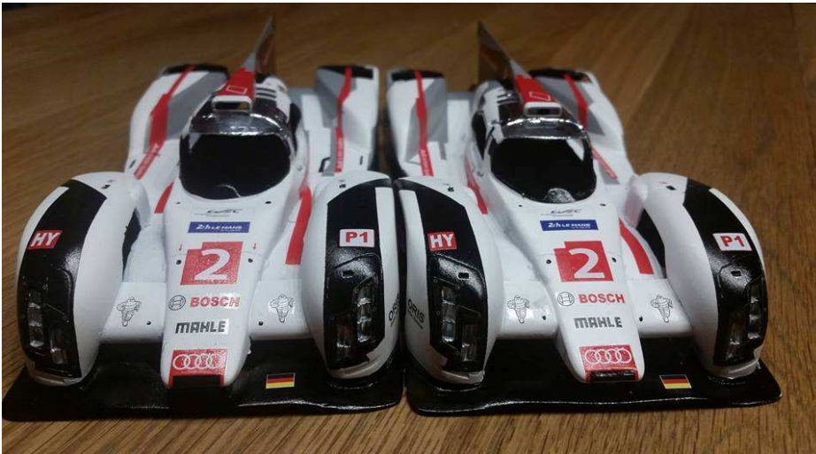
Hobby 2000 by D&G