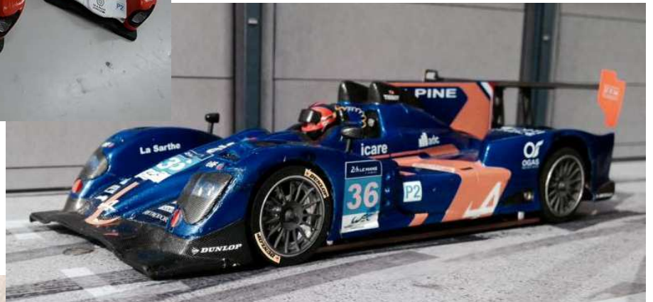
HoBS Racing Team