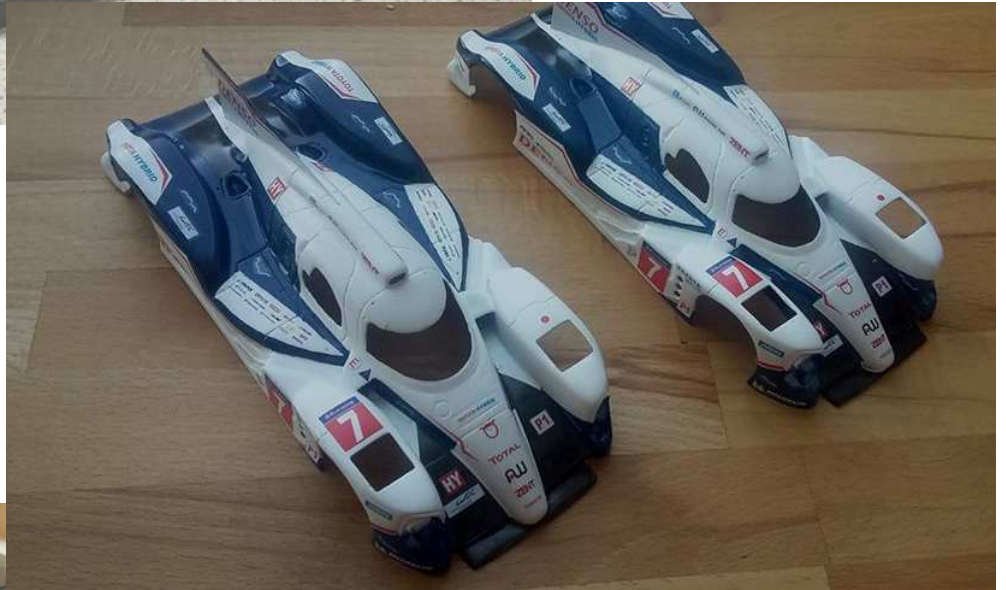
PQ1 & PQ2