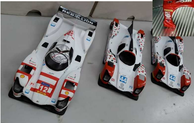
Jägerteam + Dr.Slot