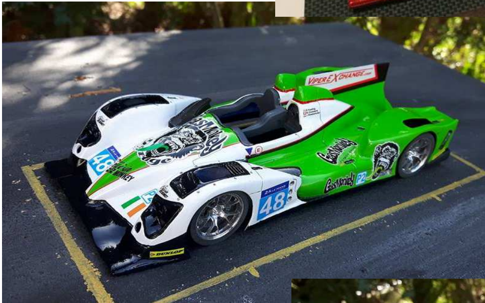
MAC-Racing by Joker