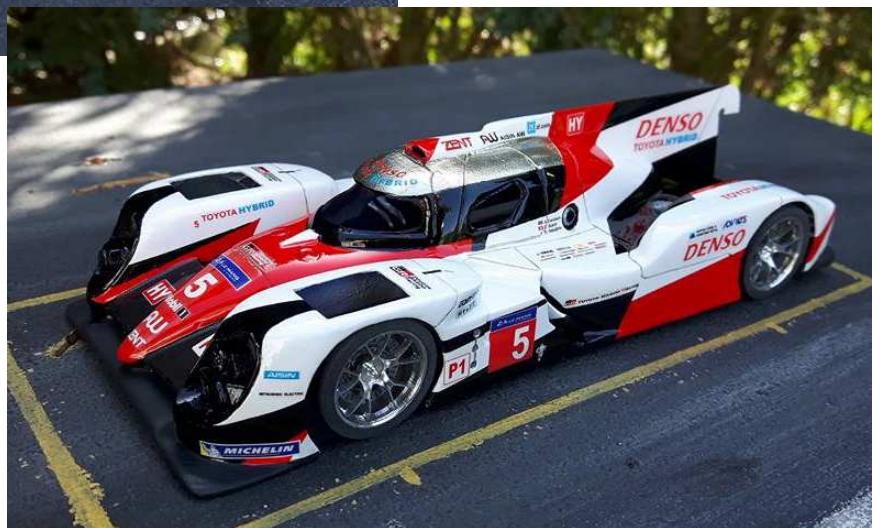
LRD International 1